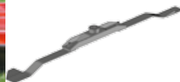
Hélice à 2 couteaux 2-blade rotor