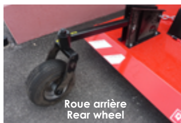
Roue arrière Rear wheel