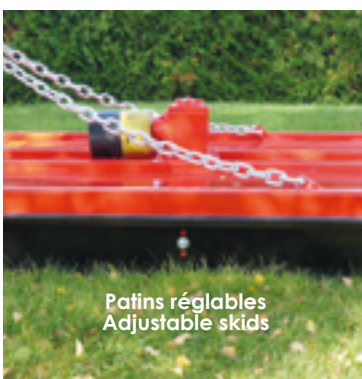
Patins réglables Adjustable skids