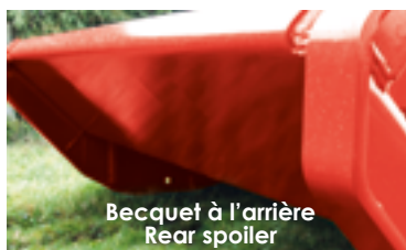
Becquet à l'arrière Rear spoiler