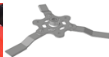
BLG 1200 hélices 3 couteaux BLG 1200 helix 3 blades