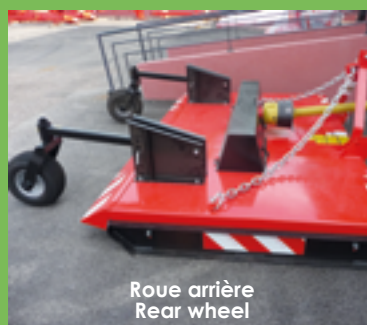
Roue arrière Rear wheel