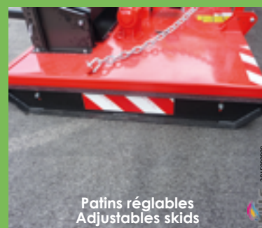
Patins réglables Adjustables skids