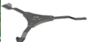
Hélice à 3 couteaux (option sur modèle 85cv) 3-blade rotor (optional on 85 HP model)