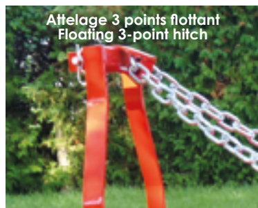
Attelage 3 points flottant Floating 3-point hitch

The BL is a robust single rotor mower, simple use. Its 85 or 120 HP gearbox provides the necessary torque and power for heavy and intensif work.