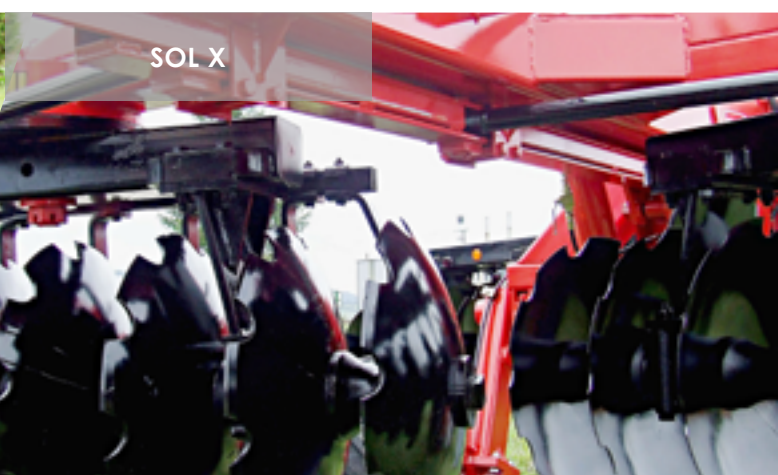
Disques crantés avant et lisses arrière (ou alternés) Front notched discs and plain (or alternated) rear discs