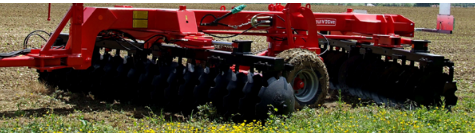
Réglage de l'ouverture des batteries hydraulique Hydraulic adjustment of the battery opening