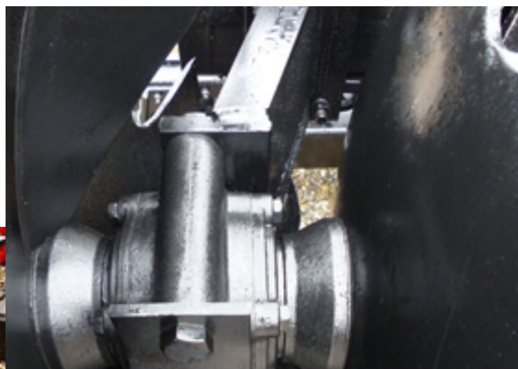
Paliers acier, roulements coniques triple étanchéité (poids 21 kg) Steel bearing housings and triple-seal tapered roller bearings (weight 21 kg)